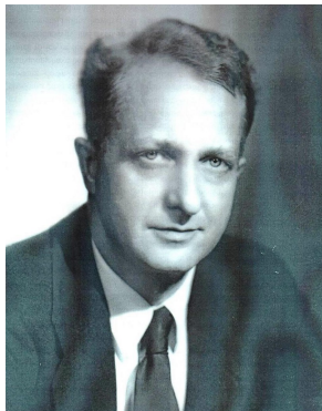
Rysunek 1: George Kingsley Zipf (1902 - 1950)

Rozkład występowania słów jest obiektem badań lingwistyki statystycznej już od ponad 80 lat. Rozkład ten przybliża prosta formuła matematyczna znana jako prawo Zipfa: