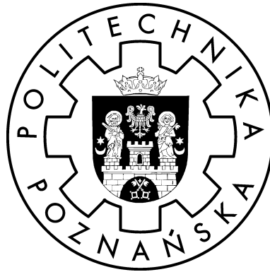
RYSUNEK B.1: Logo Politechniki Poznańskiej.