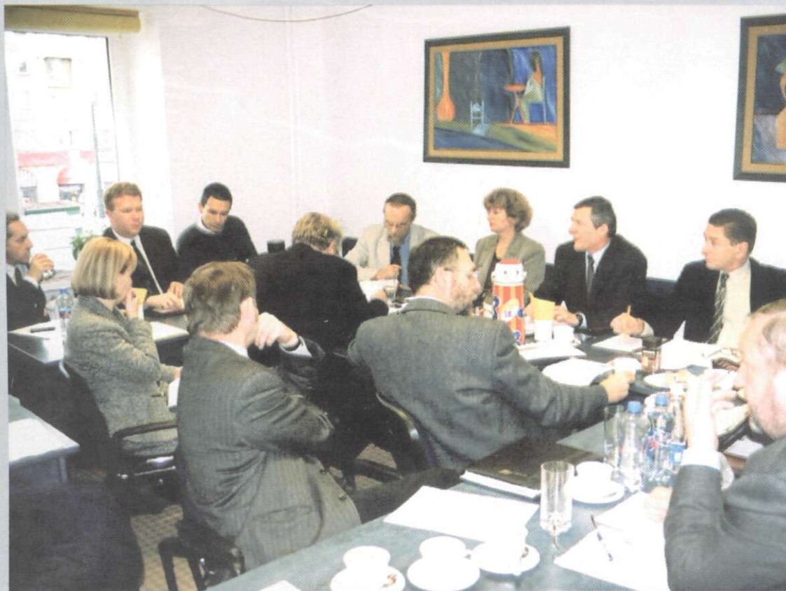
Obrady ZG PTI