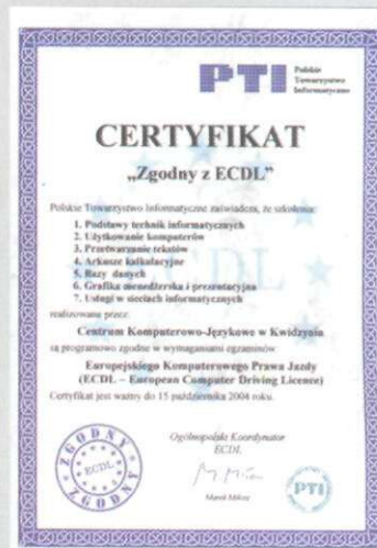
Certyfikat dla CKJ

rosłych. Bogata mediateka zawiera większość programów dydaktycznych, jakie ukazały się w Polsce. Centrum prowadzi Akademię Cisco oraz kursy, po których uczestnicy mogą składać egzaminy ECDL.